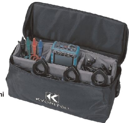
KEW 6305 z cęgami Nr kat. 103907