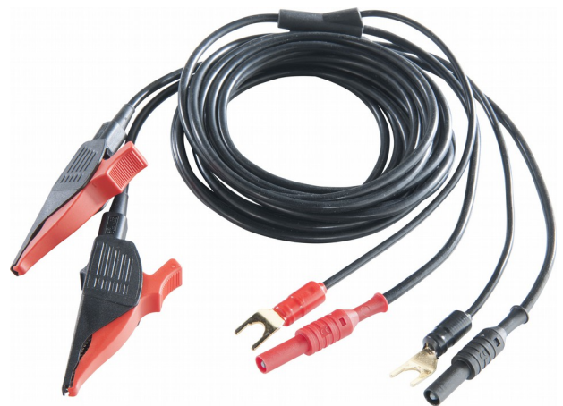
Kable pomiarowe z zaciskami Kelvina